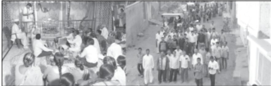
લીલીયા, લીલીયામાં બાલકૃષ્ણ લાલજીની હવેલી દ્વારા શ્રી મહાપ્રભુજી સેવા સમિતિ દ્વારા અખંડ ભૂસુંડલાવાચાં જગદગુરૂ શ્રી વલ્લભાચાર્યનો ૫૪૧ મો

બાલકૃષ્ણ લાલજીની હવેલીમાં કાર્યક્રમોનું આયોજન : ગોટાવદર, ખુંજાપાદર સહિતના ગ્રામ્ય વિસ્તારમાંથી પણ અનેક લોકો જોડાયા