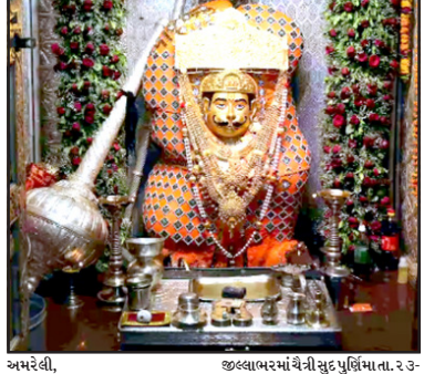
અમરેલી, જીલ્લાભરમાં ચેની સુદ પુર્ણિમા તા. ૨૩-૪ મંગળવારના હનુમાન જયંતિ આવતી

સહિત જીલ્લાભરમાં ઠેર ઠેર હનુમાનદાદાની ડેરીએ હનુમાન ચાલીયા, સત્યનારાયણ ભગવાનની વાકુનીધાર, લાલાવાવ, બાલાજી, ક્યા, ભજન, ધુન, ભટક ભોજન તેમજ પ્રસાદની વ્યવસ્થાઓ કરવામાં આવે છે.