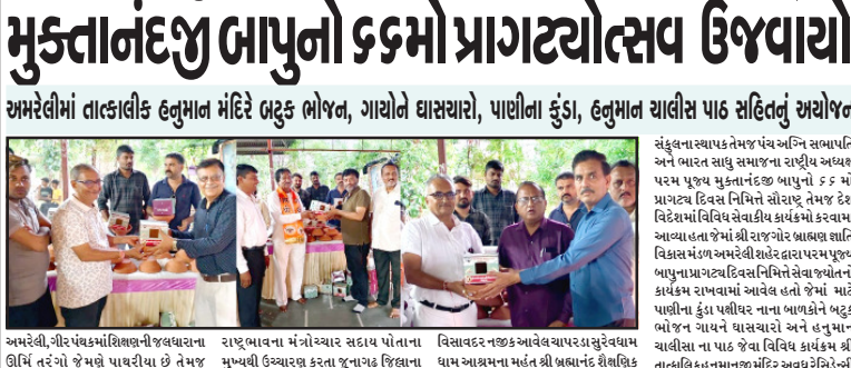
અમરેલીમાં તાત્કાલીક હનુમાન મંદિરે બટુક ભોજન, ગાયોને ઘાસચારો, પાણીના કુંડા, હનુમાન ચાલીસ પાઠ સહિતનું અયોજન કરવામાં આવ્યું હતું. આ પ્રસંગે અમરેલીના અગ્રણી ગાયત્રી યજ્ઞ યોજાયો.