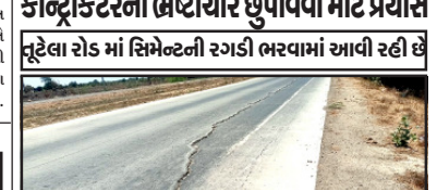
કોડીનાર, ડોળાસા, કોડીનારથી ડોળાસા સુધી નેશનલ હાઇવે યોજાઈ રહેલા કોર ટ્રેક સીટ-૨૦ રોડ નું કામ ૨૦૧૫ થી ગોકળ ગાય ની ગતિ થી ચાલુ છે. આરોડમાં ભ્રષ્ટાચાર ચાલુ છે. કોડીનારમાં સિનેમામાં ફાયર સેફ્ટીના અભાવે લાયસન્સ રદ કરવામાં આવ્યું