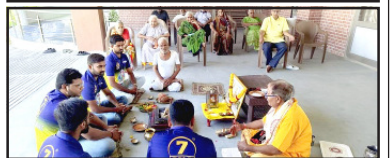
અમરેલી, સારહી યુથ ક્લબ ઓફ અમરેલી સંચાલિત 'નિરાધાર નો આધાર' સારહી તપોવનમાં ગાયત્રી યજ્ઞ યોજાયો. આ પ્રસંગે અમરેલીના અગ્રણી ગાયત્રી યજ્ઞ યોજાયો. આ પ્રસંગે અમરેલીના અગ્રણી ગાયત્રી યજ્ઞ યોજાયો.