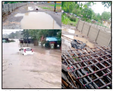
શ્રી. જેમાં ડ.૮૮ કુટુંબ પાણી આચ્છાદિતું. અનરાધાર વરસાદનાં કારણે બગસરામાં

અમરેલી, અમરેલી શહેર અને જિલ્લામાં ગત રાત્રીથી દિવસ દરમિયાન હવામાન વિભાગની ભારે વરસાદની આગાહીનાં પગલે બગસરા શહેર અને પંથકમાં સાંભેલાધારે ૫ થી ૬ ઇંચ જેવો ધોધમાર વરસાદ પડી જતા ચારેય બાજુ પાણી પાણી થઈ પડ્યું હતું અને ઉપરવાસનાં સારા વરસાદને કારણે મુંઝાસર રહેતી સપાટી ૧૮ કુટુંબોંધથી