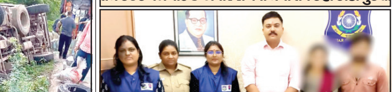
તને કંઈક વળગાડ છે અમારે રાખવી નથી તેમ કહી કાઢી મુકેલી