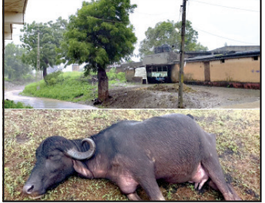
નુકશાન થયું છે, સાવરકુંડલાનાં (અનુ. પાના નં.૦)

દિવાળી નજીક આવી : ખેડુતોના હાથમાં રૂપિયા ક્યાથી આવશે ? : સરકારી નોકરીયાતોના પગાર ઉપર દિવાળી ન થાય