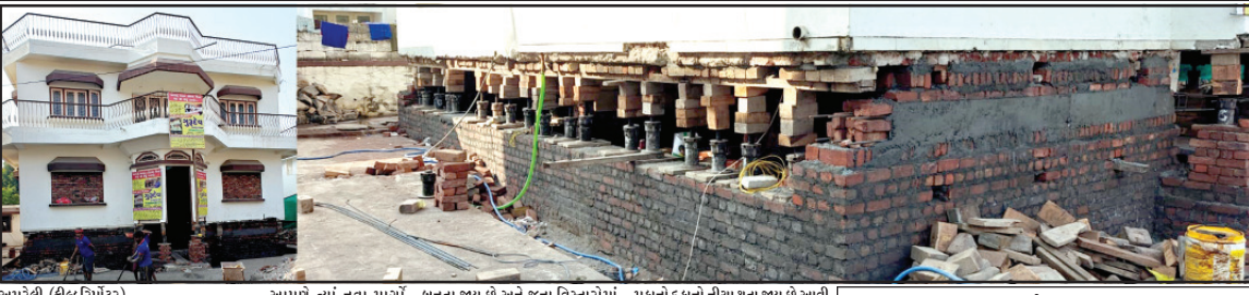
અમરેલી, (સીદ્ધશિપોર) આપણે ત્યાં નવા માર્ગો બનતા જાય છે અને જુના વિસ્તારોમાં મકાનો દુકાનો નીચા થતા જાય છે આવી