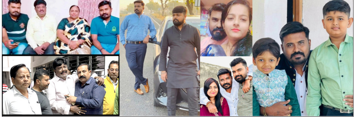
અમરેલી, યોગાનુ યોગ હોય કે પછી કે પછી કુદરતી સંકેત હોય તેમ ગત રાત્રીનાં માતા-પિતા, ભાઈ, પુત્ર, બહેન, બનેલી સહિતનાં પરિવારનું સ્ટેટસ સ્વ. સશ્ત્રી ડાબસરાએ સોશયલ મિડીયામાં શેર કર્યું હતું. સ્વ. સશ્ત્રી ડાબસરાએ સોશયલ મિડીયામાં પરિવાર સાથેની યાદો શેર કરેલ તેના ૧૪ કલાક માં જ તેમના અગ્રણે નિવનનાં સમાચારે સૌને વિચારના કરી મુક્યાં છે. અમરેલી સિવિલ હોસ્પિટલે સશ્ત્રી ડાબસરાનાં સમાચાર સાંભળી લોકો ઉમટ્યાં હતાં.