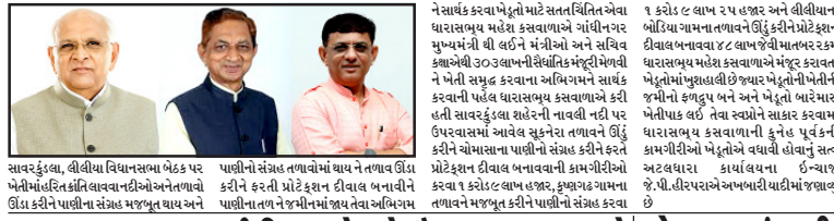
સાવરકુંડલા, લીલીયા વિધાનસભા બેઠક પર મેળીમાં હરીત કાંતિ લાવવાનો દ્યારાસભ્યશ્રી કસવાળાનો ખેડૂત હિતાઈ પ્રયાસ સફળ થયો

કૃષ્ણાગટ તળાવ માટે ૧૪૬ લાખ, નાવલીના સુકુનેરા ડેમ માટે ૧૦૯ લાખ અને બોડિયા તળાવ માટે ૪૮ લાખ મંજૂર : કેટલાંમં હરીત કાંતિ લાવવાનો દ્યારાસભ્યશ્રી કસવાળાનો ખેડૂત હિતાઈ પ્રયાસ સફળ થયો