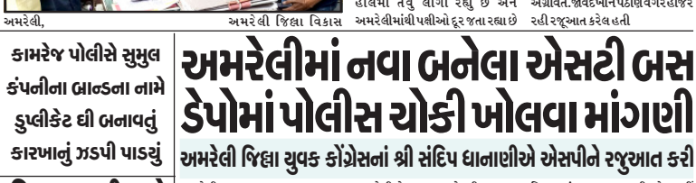
અમરેલી, અમરેલી જિલ્લા વિકાસ

અમરેલી જિલ્લા વિકાસ સમિતિ દ્વારા એડીશનલ કલેક્ટરને રજુઆત કરાઈ