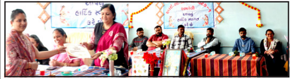
આઈ.સી.ડી.એસ. વિભાગ દ્વારા ચાલતી આંજણવાદીઓમાં જે લાભાર્થી અને ટી.એચ.આર (માનુશક્તિ, માલશક્તિ, અને પુણશક્તિ) અને મિલેટ (શ્રી અમ) મંથી બનતી 'પોષિક આયુર્વીદ્ય સ્વચ્છ' નું આયોજન કરવામાં આવ્યું જેમાં મહિલા અને બાળ વિકાસ વિભાગ લાભાર્થીઓના પોષણ અને આરોગ્ય માટે સતત પ્રયત્નો કરવામાં આવ્યાં છે. ભાગ્યકર્તા, કિશોરીઓ, સગાં મહિલાઓ અને યાત્રી માતાઓ સુપરપ્રોમોટિવ બને તેમજ તેમનાં રોજિંદા આહારમાં પોષિક પદાર્થોનો ઉપયોગ થાય તે ખુબ જરૂરી છે. કેવલી પ્રોટીન અને સુખ્ય પોષકતત્વો યુનિટેક હોમીયોપાથી (માનુશક્તિ, માલશક્તિ અને પુણશક્તિ) દર માસે વિભાગમાં આયોજવાની કેટમંથી સમિતિ દ્વારા પોષકતત્વો જરૂરીયાતનાં એક તુલીયાંસ ભાગનું પોષણ પૂરું પાડવા માટે આપવામાં આવે છે. અને મિલેટ (શ્રી અમ) નાના દાણા વાળા ધાન્ય પાકોનું જુલ છે, જેમાં વિવિધસમર પાકો જેવા કે, બાજરી, જુવાર, નાનાલી (રાસી), કાંબુ, ચણા, બંદી (સામો), કોરેલી, રાવી વગેરેનો સમાવેશ થાય છે, જેમાં મોટા ઉપસ્થિત રહેલ છે.