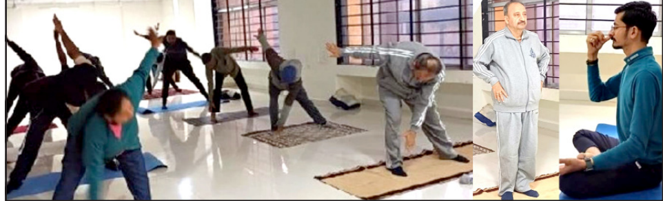
પહેલા પાનાનું - યોગસેશન યોગ પ્રશિક્ષણ આપવામાં આવ્યું હતું. શ્રીમ વિકાસ એજન્સી હેલ્થ ફરજ યોગ પ્રવાચનની તમામ શાખા જિલ્લા અમરેલી જિલ્લા વિકાસ અધિકારીશ્રીઓ આરોને આ યોગ સેશનનો લાભ લેવા એક અપભયારી યાદીમાં અનુરોધ કરાવ્યો હતો.